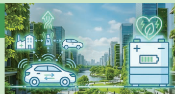
ニチコン 蓄電システム