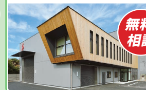
YUASA 総合エンジニアリング部