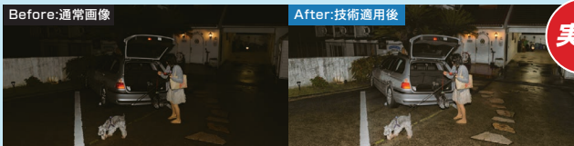
ロジック・アンド・デザイン

夜間・逆光・悪天候 —あらゆる視界不良を「見える化」 独自のアルゴリズムが、現場の映像を“証拠”に変える